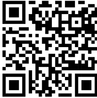
QR Code EIT

โดยการแต่งตั้งคณะกรรมการเตรียมการประเมินคุณธรรมและความโปร่งใสในการดำเนินงานของสถานศึกษาเพื่อตรวจสอบ วิเคราะห์ข้อมูลให้ถูกต้อง ตรงประเด็นการประเมินและเพื่อความโปร่งใสในการปฏิบัติงานประจำปีงบประมาณ พ.ศ. ๒๕๖๖ และเปิดโอกาสให้ผู้มีส่วนได้ส่วนเสียได้มีโอกาสเข้ามาประเมินความโปร่งใสของสถานศึกษา โดยการจัดทำ QR Code EIT ขึ้นเว็บไซต์ของสถานศึกษา